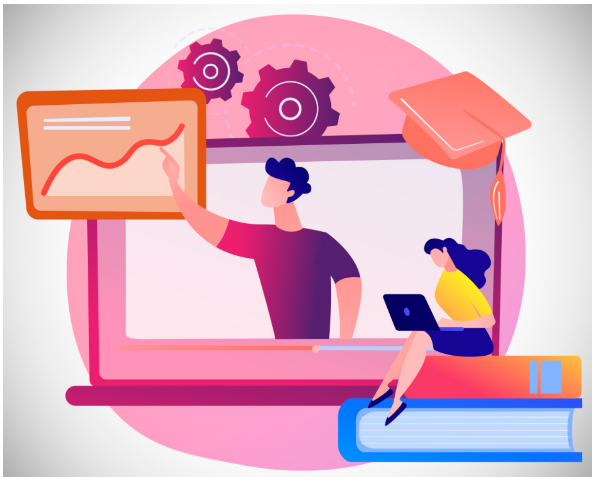
Cómo impartir una clase online