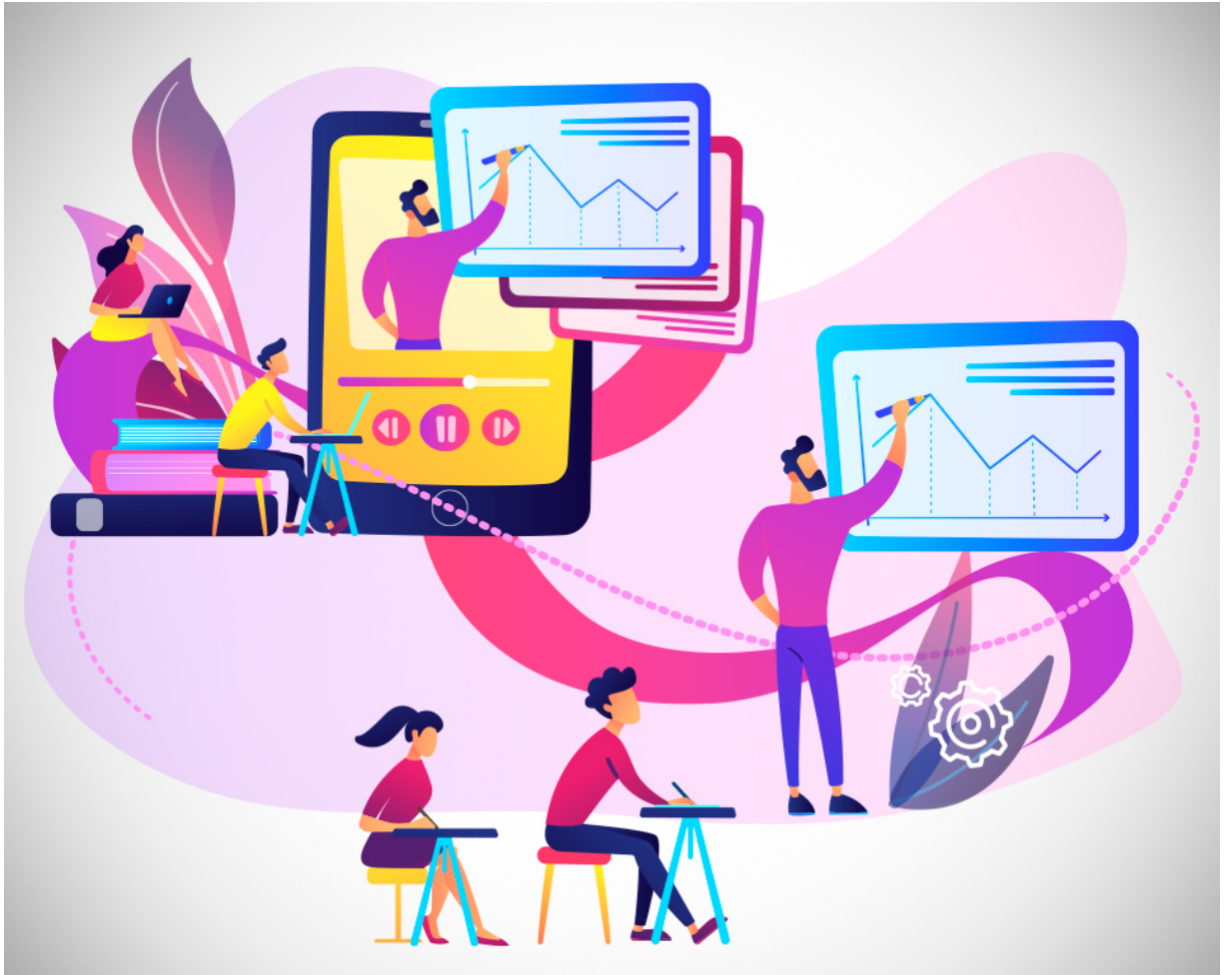
Cómo impartir una clase híbrida (presencial/online)