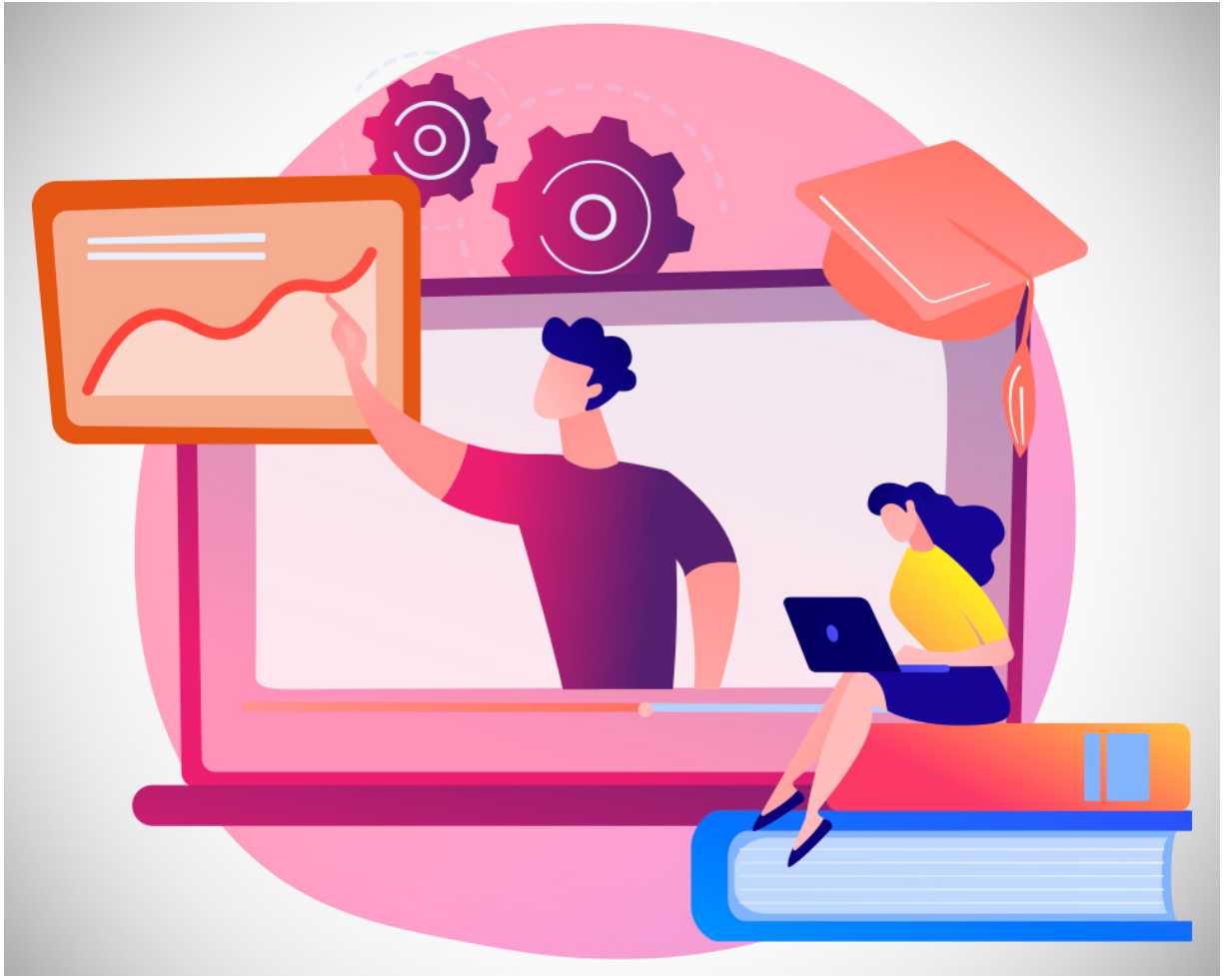
Cómo impartir una clase online