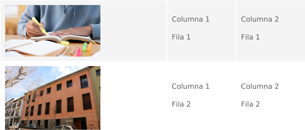
Tabla de ejemplo

Es ideal revisar que todos los elementos que usamos en la construcción de una noticia o página extendida, se visualiza correctamente en distintos dispositivos, y de no ser el caso buscar alternativas, como por ejemplo evitar el uso de imágenes dentro de tablas, puesto que su visualización en dispositivos móviles no es la correcta.