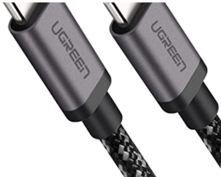
Cable con conector tipo C

Es importante tener en cuenta que, en la mayoría de los casos, los conectores tipo A tienen una posición correcta y otra incorrecta, de modo que hay que realizar la conexión en la posición adecuada.