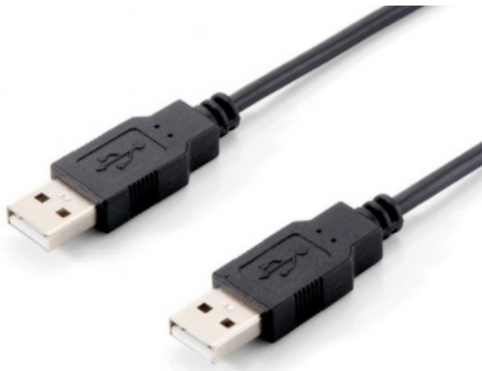
Cable con conector tipo A