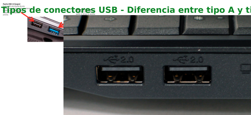
Portátil con conectores tipo A