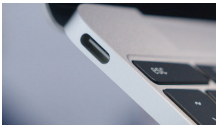
Portátil USB tipo C