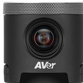
Cámara AVER 340+ (sobremesa), con micrófono incorporado