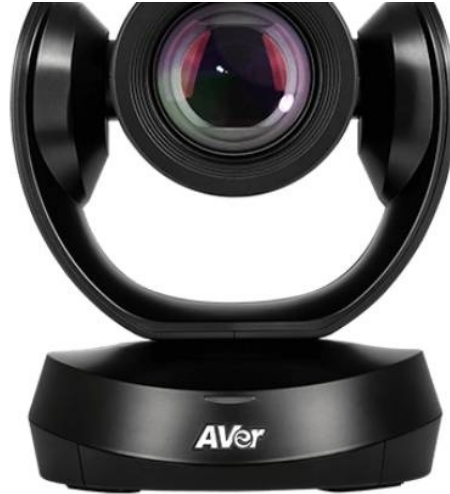
Cámara AVER 520 Pro (instalada en techo). Sin micrófono

Para poder saber qué sección es la que es preciso leer en los apartados que hay a continuación, os sugerimos identificar la cámara que tiene el aula e ir directamente al apartado que corresponda.